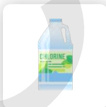
Traitement chimique des surfaces infestées