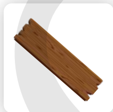
Remplacement du bois endommagé