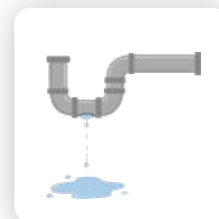
Réparations des fuites d'eau

Les entreprises DUO-DIAG qui assurent cette prestation :